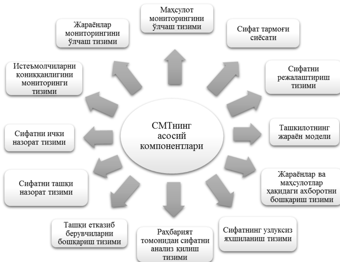
1-расм. СМТнинг асосий компонентлари

Уни ҳар гал янада юқорироқ даражада такрорланувчи ҳамда ўзида сифат соҳасида ташкилот сиёсатини ва мақсадларини ишлаб чиқиш, сифатни режалаштириш, сифатни бошқариш, сифатни таъминлаш ва сифатни яхшилашни намоён этадиган узлуксиз жараён(цикл) сифатида тасаввур этиш мумкин.